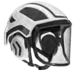
Protos® Integral ARBORIST

Art: 204000 (G16-Visier) Art: 204002 (F39-Visier)