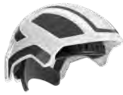
Protos® Integral INDUSTRY