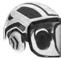
Protos® Integral FOREST

Art: 204000 (G16-Visier) Art: 204002 (F39-Visier)