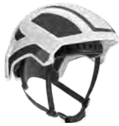
Protos® Integral CLIMBER