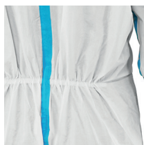
Serrage élastique à la taille