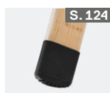
Werkzeugtasche Fußverlängerung Gummischuhset