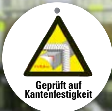
Geprüft auf Kantenfestigkeit