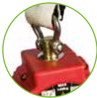
Drehwirbel am Gehäuse

Zertifiziert gemäß den Anforderungen der EN 360: 2002 VG11.085 (Fallfaktor 2) + VG11.060 (kantengeprüft) zugelassen für 140 kg (VG11.062)