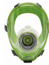
Maschere intere BLS 5400 - BLS 5150