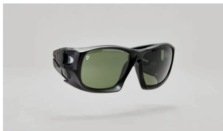
C22 – Montatura per lenti correttive.