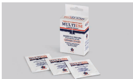
Q530 – Salviette disinfettanti multiuso.