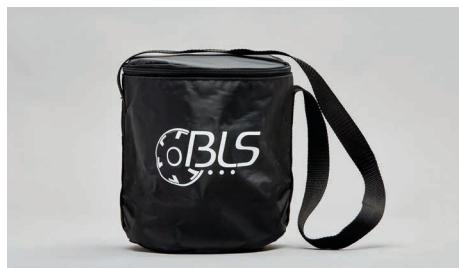
C43 – Borsa tessile con tracolla.