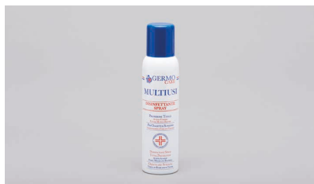
Q409 – Spray disinfettante (150ml).