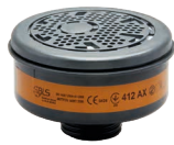
Filtri serie BLS 400