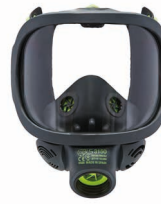
Maschere intere BLS 3000