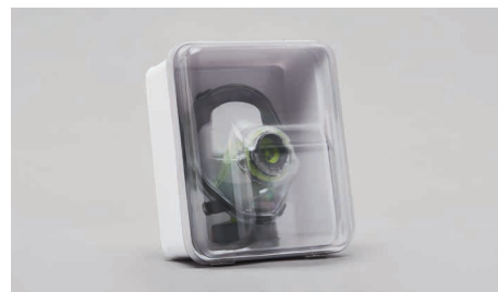
C90 – Contenitore appendibile.