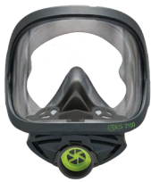
Maschere intere BLS 2150 - BLS 2150V